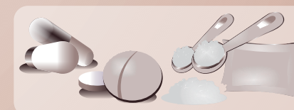
Comprimidos, Drágeas e Pós