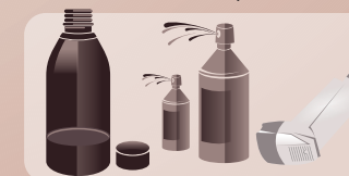
Líquidos e Sprays

Atenção! Não existe medicamento sem risco.