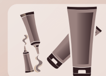
Pomadas e Cremes